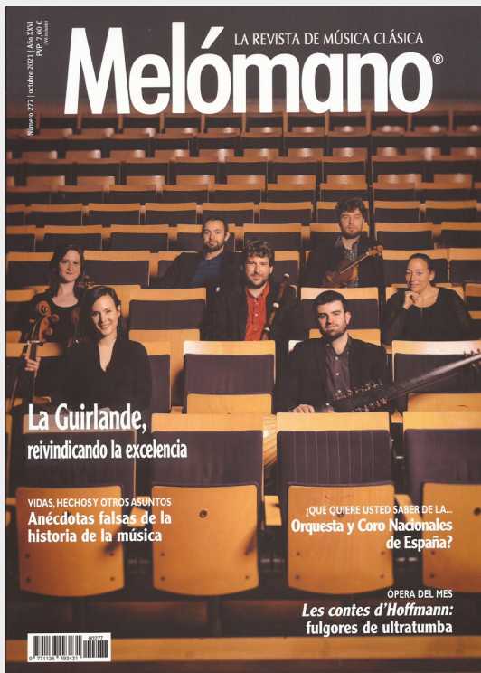
La Guirlande Portada de la revista Melómano. Octubre 2021